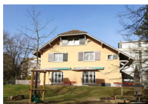
Bout du Monde