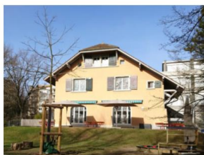
Bout du Monde